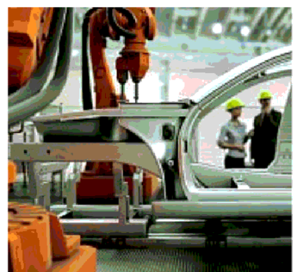
Il trend L'automotive fra i comparti più colpiti dalla frenata